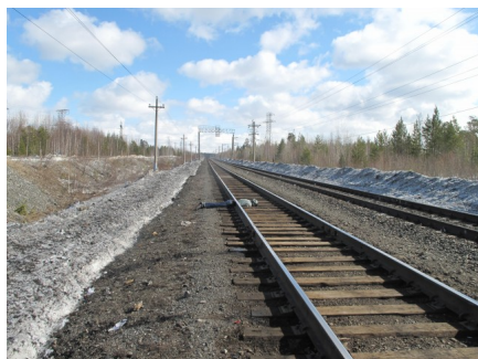
фото с места происшествия 18+

А два дня назад на станции Салым подобным образом погиб мужчина. По предварительной информации, он пытался пролезть под вагонами товарного состава, когда тот неожиданно тронулся с места. Мужчину так же разрезало пополам.